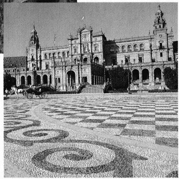
Plaza de España, Sevilla