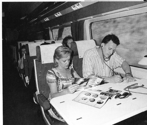
A bordo del AVE